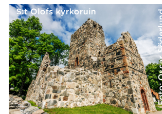
S:t Olofs kyrkoruin

Sigtuna anlades som ett kristet samhälle och under medeltiden fanns det inte mindre än sju stenkyrkor i staden. Det finns idag tre kyrkoruiner kvar: S:t Per, S:t Lars och S:t Olof, alla byggda på 1100-talet. Mariakyrkan byggdes av munkar i dominikanorden under 1200-talet och är den äldsta tegelbyggnaden i Mälardalen. Kyrkorna i Norrsunda, Skånela och Husby-Årlinghundra byggdes på 1100-talet och är tre av Sveriges sällsynta kyrkor med kyrktorn i öster.