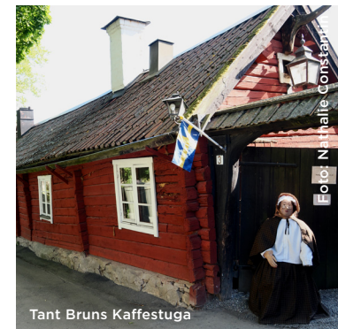
Tant Bruns Kaffestuga