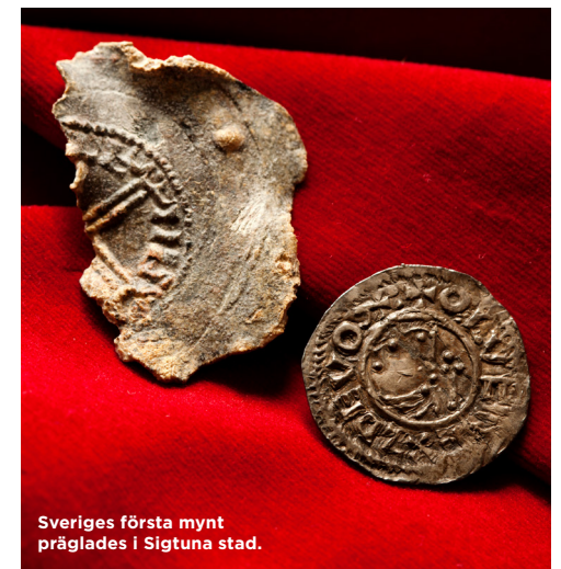
Sveriges första mynt präglades i Sigtuna stad.

Olofs dotter, Ingegerd, blev en mäktig kvinna då hon gifte sig med furst Jaroslav. Under deras välde byggdes Sofiakatedralen i Kiev. Hon var rådgivare och fredsbevarare i det som idag är Ukraina och Ryssland. Hon blev senare ett helgon i den ortodoxa kyrkan, Sankta Anna. Ingegerdsleden, uppkallad efter Sigtunaprincessan, är en 11 mil lång, lättvandrad led som sträcker sig från Storkyrkan i Stockholm, via Mariakyrkan i Sigtuna, till domkyrkan i Uppsala.