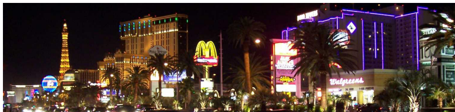
Las Vegas.