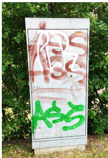
Elskåp som står mittemot runsten nummer 5, elskåpet är ungefär lika stort, och har samma färg som runstenen, båda handlar om att människor vill berätta "här var jag".

Har ni sett klotter i tunnlar och på elskåp? I alla tider har människor klottrat och lämnat spår i grottor, på hus och föremål. Spår som berättar om att "här var jag".